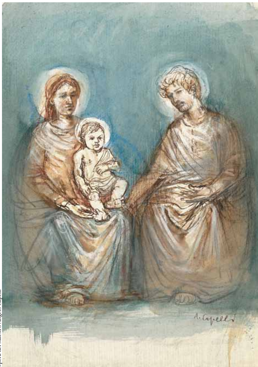
Opera del Maestro Angelo Capelli