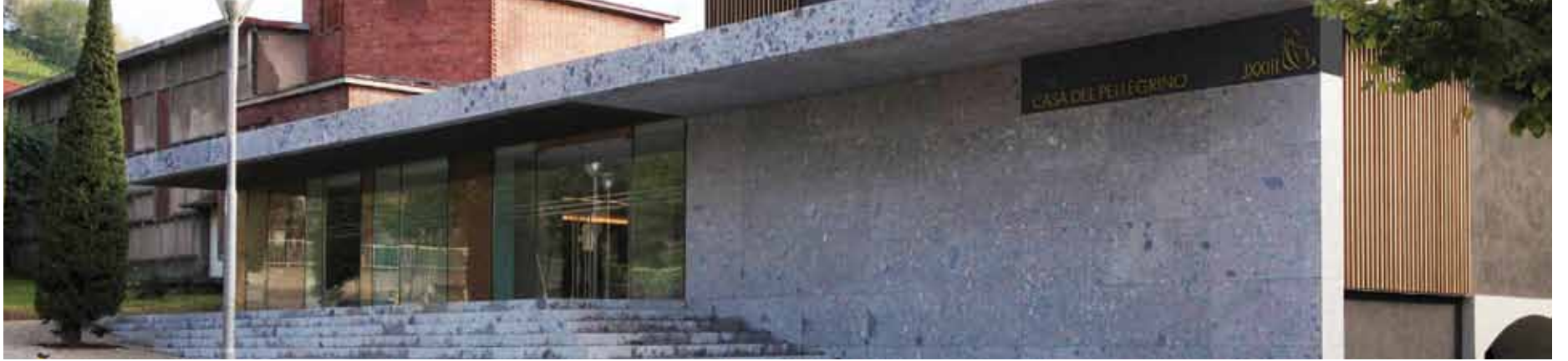
La casa del Pellegrino

Periodico di informazione della Città di Sotto il Monte Giovanni XXIII