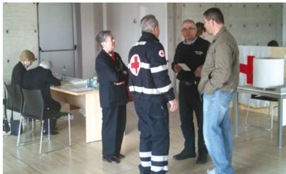
La Croce Rossa durante la giornata del 13 marzo 2010

GRANDE AFFLUENZA PER LA GIORNATA DELL'OSTEOPOROSI CON ESAME MOC GRATUITO