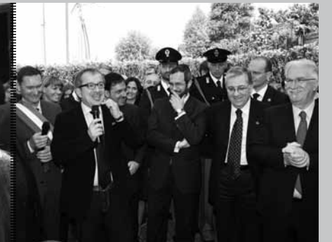
La consegna della villa confiscata

Ricordo con chiarezza i tempi in cui Giovanni Falcone e Paolo Borsellino lavoravano a Palermo, per salvarne l'anima e la gioventù migliore dal ricatto e dalla povertà, e si viveva come in una Beirut nostrana. Ricordo le denunce dei commercianti per il disturbo provocato dalle sirene, le lettere ai giornali dei condomini per il rumore fatto dagli elicotteri di scorta, le battute invidiose dei politici, poi rivelati corrotti, nei confronti della notorietà dei magistrati e dei giornalisti che decisero – e decidono ancora – di esporsi, di combattere, di arrestare il processo di conquiste mafiose. Ricordo il silenzio dei cittadini non schierati, amici affettuosi della mafiosità seppur non mafiosi, ricordo le segreterie dei politici locali con la fila dei disperati che chiedevano il favore di un lavoro, di un ricovero, di un diritto per favore. Questo purtroppo succede ancora. Ricordo la mia scuola elementare senza giardino, al pomeriggio nel secondo turno, ricordo come il comune di Palermo abbia pagato per anni l'affitto ai costruttori mafiosi per poter occupare le aule del mio liceo, ricordo la convinzione degli imprendito-