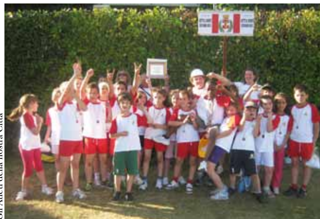
Gli Atleti della nostra Città

Questo strumento è messo al servizio anche delle attività commerciali e produttive presenti sul territorio in quanto una parte dello schermo sarà a disposizione per comunicazioni commerciali e promozionali : con un semplice tocco sullo schermo si aprirà una vetrina virtuale e le immagini, i filmati e le fotografie potranno animarsi secondo le scelte interattive dell'utente che desidera avere un primo contatto con l'offerta commerciale del nostro paese.