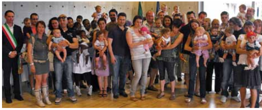
Festa dei Pulcini

Domenica 22 maggio, in occasione della Festa dei Pulcini , è arrivata a Sotto il Monte la "Carovana del Gioco", manifestazione itinerante e sovra comunale, gestita dalla cooperativa LINUS. Questo evento prevede l'allestimento di pome-riggi di festa in cui il gioco diventa un'esperienza aggregativa di puro divertimento per la comunità. L'evento di quest'anno ha portato in piazza Giovanni Paolo II il "Ludobus" giallo targato LINUS, un furgone carico di giochi di tutte le misure, per bambini, ragazzi, giovani ed adulti di tutte le età. La cu-