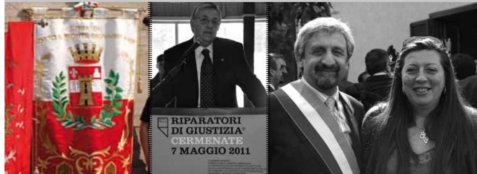
Giuseppe Pignatone capo DDA di Reggio Calabria

Il 7 maggio scorso, a Cermenate, in provincia di Como, si è svolta una manifestazione dedicata alla promozione della cultura della legalità. A Cermenate la 'ndrangheta aveva ben messo radici, come in gran parte del nord dell'Italia e in altri Paesi europei fino a quando lo Stato si è ripreso il maltolto. Con la confisca dei beni mafiosi e la nuova loro