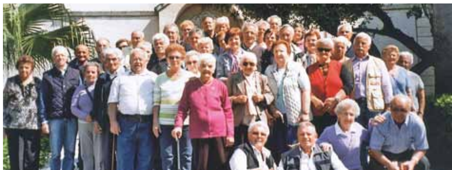
Soggiorno ad Alasio

tro le mafie, programma sociale del sindacato elaborato con Battista Villa.