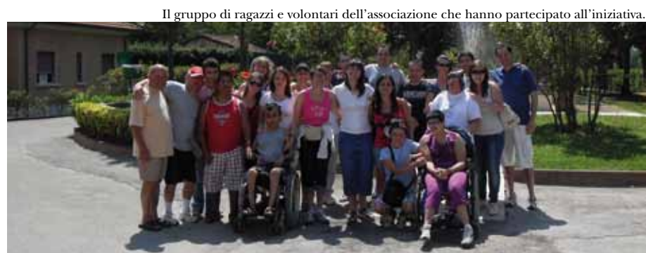
Il gruppo di ragazzi e volontari dell'associazione che hanno partecipato all'iniziativa.