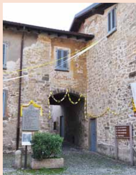
Casa Natale di Giovanni XXIII

Le fonti principali sono fonti documentarie, ma per alcuni secoli i documenti sono quasi sempre molto scarsi e sovente riportano poche notizie, per di più spesso non interessanti per queste ricerche, per altri invece sono abbondanti, ci si trova alle prese con una quantità di dati, ma solo pochi di essi servono davvero e sovente capita che manchino informazioni fondamentali. Inoltre è un lavoro che praticamente non si esaurisce mai, non solo perché la storia continua, ma anche perché è sempre