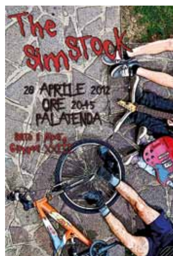
La locandina dell'evento The Simstock

Va in scena The Simstock sabato 28 aprile presso il Palatenda