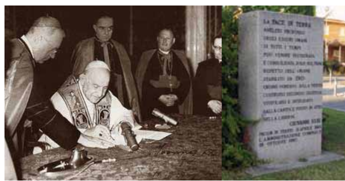
Giovanni XXIII firma l'enciclica Pacem in terris, il 9 aprile 1963