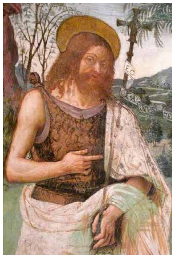
San Giovanni Battista - Pinturicchio

Cerchiamo di metterci in gioco per la nostra comunità, per la nostra umanità, perché anche nel piccolo si può fare qualcosa, perché ognuno ha un impatto sul mondo che lo circonda, sta a noi decidere se esso debba essere