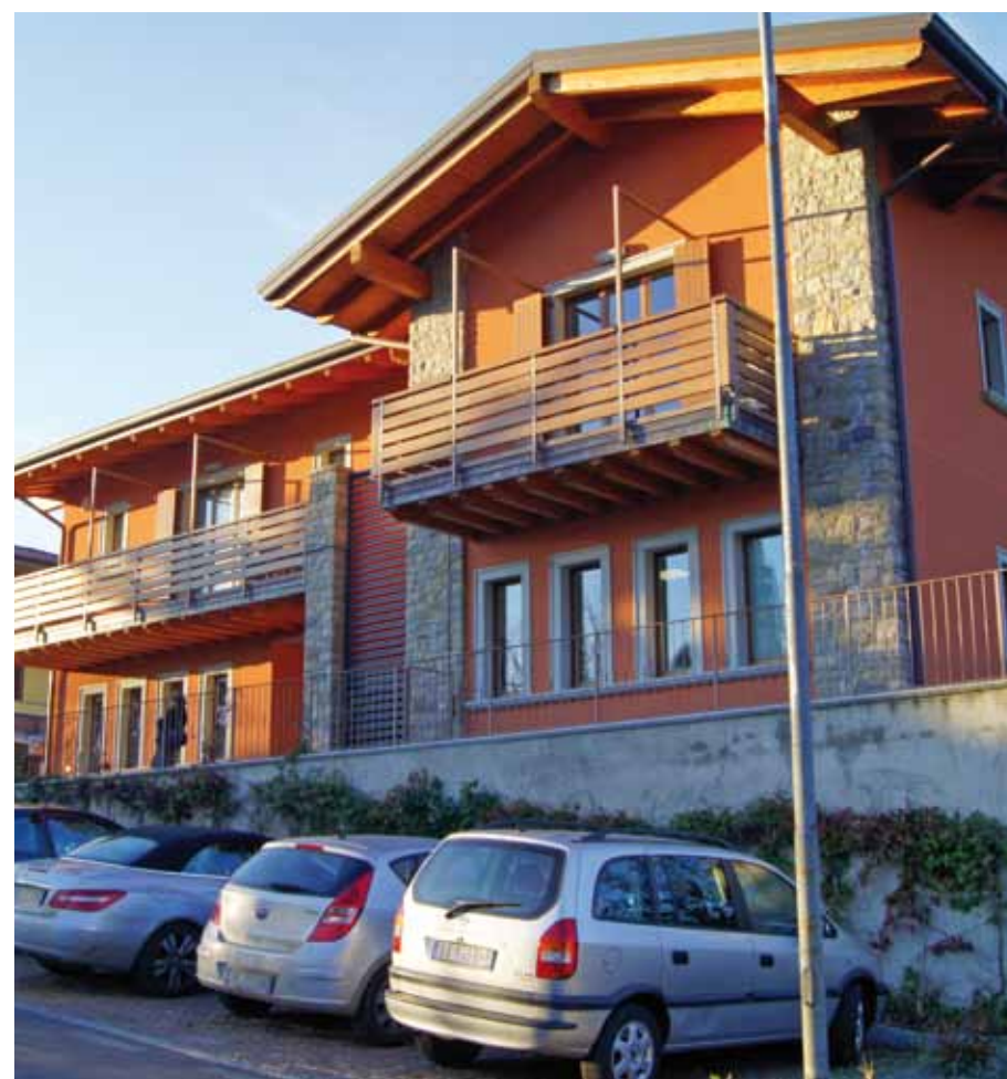
via alla Guardia