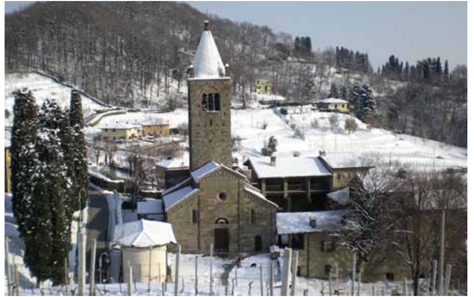
© Tutti i diritti riservati di DACO 61

Da Virgilio a Saba, da Cicerone a Hesse; il corso porpone un viaggio letterario attraverso l'Italia, vista dai grandi autori della letteratura di tutti i tempi, per vedere il mondo con gli occhi degli altri e