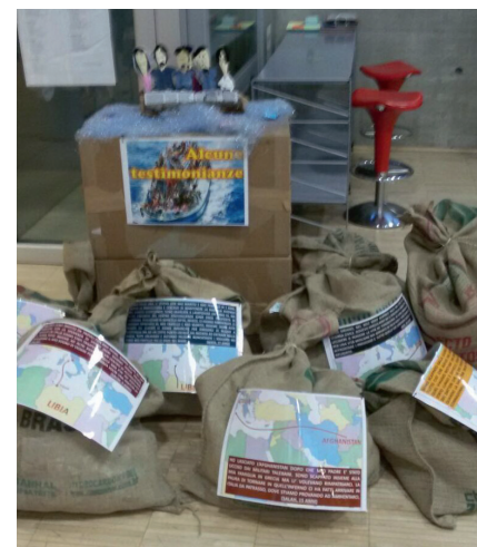
1° classificato il "Mondo in casa" Scuola Media

Per maggiori informazioni e/o iscrizioni rivolgersi all'Ufficio Servizi Sociali (035/791343 interno 5 - servizisociali@comune.sottoilmontegiovanixxiii.bg.it ).