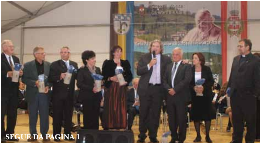
SEGUE DA PAGINA 1

L'Amministrazione Comunale, nell'ambito degli scambi culturali con Marktl am Inn, paese della Baviera noto per aver dato i natali a Benedetto XVI e gemellato con Sotto il Monte Giovanni XXIII dal 2009, ha organizzato una vera Oktoberfest.