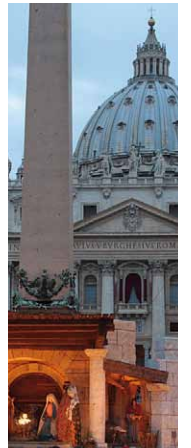
S. Natale in Piazza San Pietro a Roma

Tratto dal Radiomessaggio del Santo Padre Giovanni XXIII ai fedeli e ai popoli di tutto il mondo in occasione del Natale. Giovedì 21 dicembre 1961.