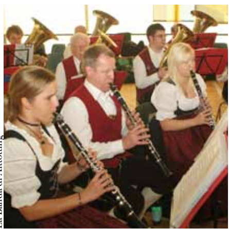
La Banda di Altötting

Incitati dalla folla festosa la banda ha riscaldato l'ambiente.