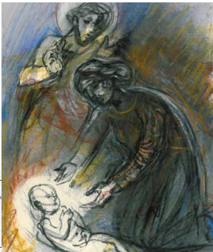
Opera del Maestro Angelo Capelli

AUGURI alle associazioni di volontariato e a quelle culturali che possa-