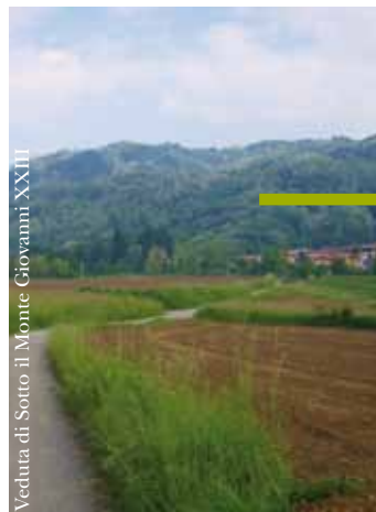
Veduta di Sotto il Monte Giovanni XXIII