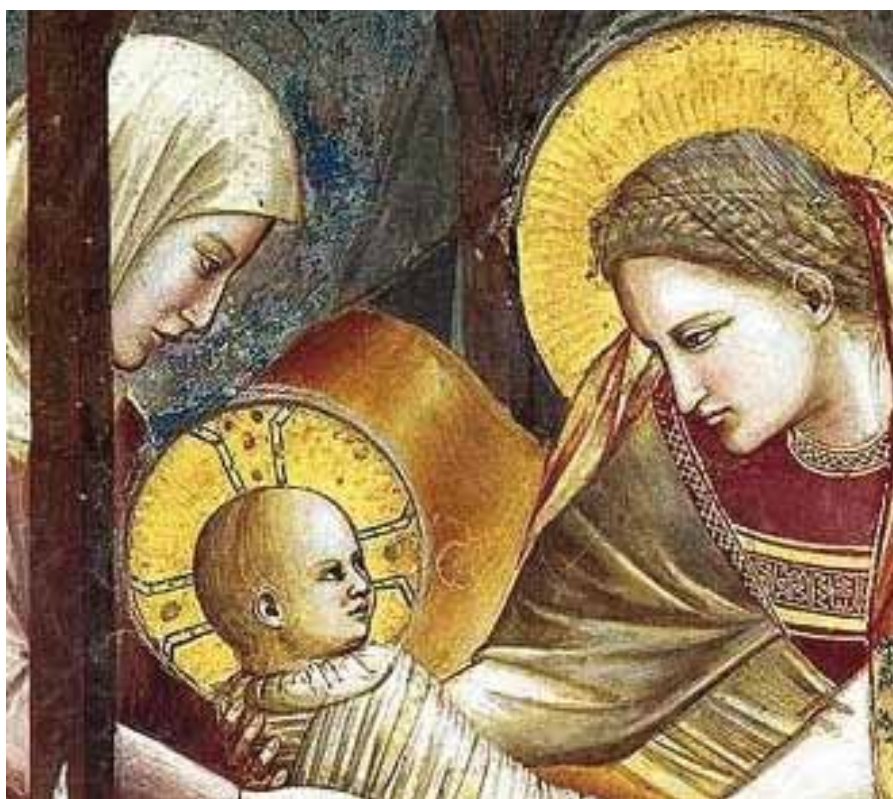
Natività di Giotto

Carissimi cittadini, desidero esprimere un breve pensiero, che mi auspico acquisti un valore universale, affinché l'augurio di Buon Natale che corre di bocca in bocca da duemila anni, svincolandosi spesso dalla fede che ne fonda il senso, andando oltre la cultura e la tradizione cui appartiene, depositi in ogni cuore il vero senso dell'umano e della storia.